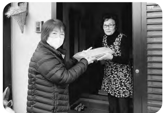
▲おいしいお弁当をどうぞ! (宮崎地区)

配達当日は寒さも厳しかったですが、お弁当をお渡しする時には笑顔が生まれ、その場をほっこりとあたたかくしてくれました。