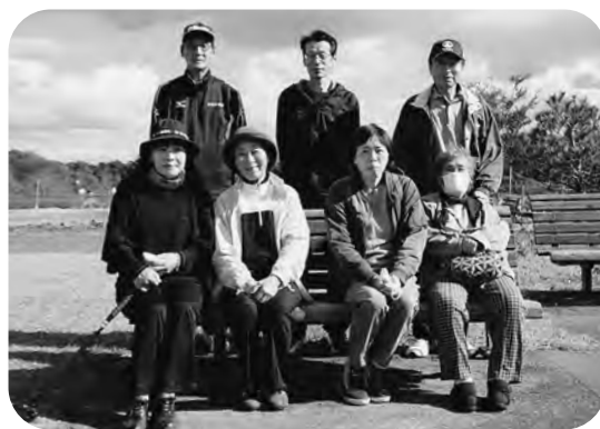
▲みんなで記念撮影

日頃の介護をリフレッシュできるように、次年度も様々な企画を考えていきますので、皆さまのご参加をお待ちしております。