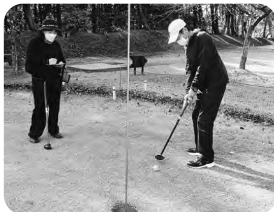
▲次で入るように慎重に…