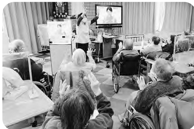
▲1月より新たなレク機材を導入し、機能訓練や健康体操をパワーアップ♪ぜひご利用ください!!

★お問合せ先★（問合せ対応時間：午前 8 時 30 分～午後 5 時 15 分）