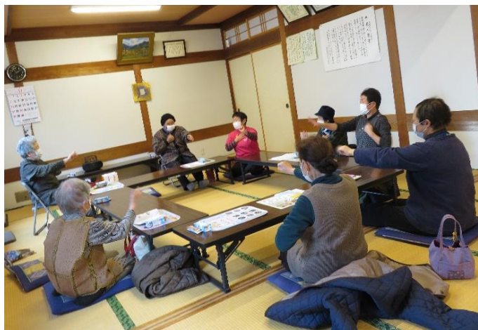
みんなで楽しく手指の健康体操！

11月16日、転作センターにおいて1年9か月ぶりに『ひばり会』が開催されました。