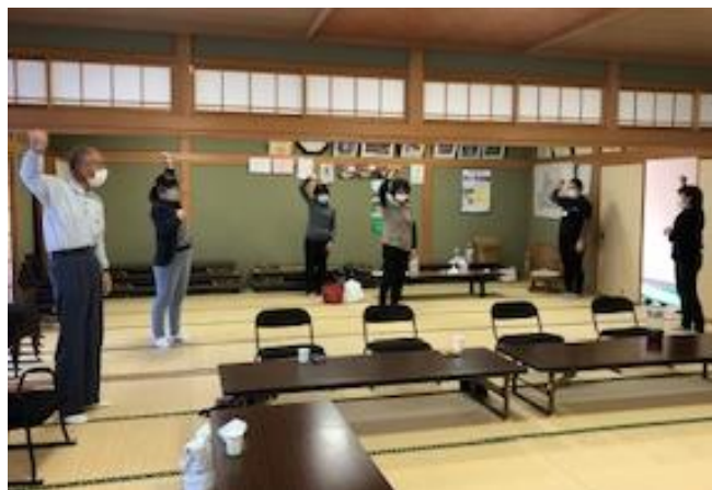
サロンの最後に『北国の春』の曲にあわせて健康体操をすることになりました。

今後は月に1回程度の開催を予定しており、回覧でお知らせをするとのことです。13区の高齢者のみなさんはぜひご参加ください。