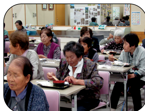
美味しい料理に舌鼓