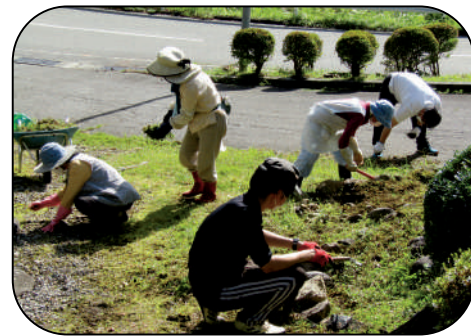
松越地区にある慰霊碑を清掃