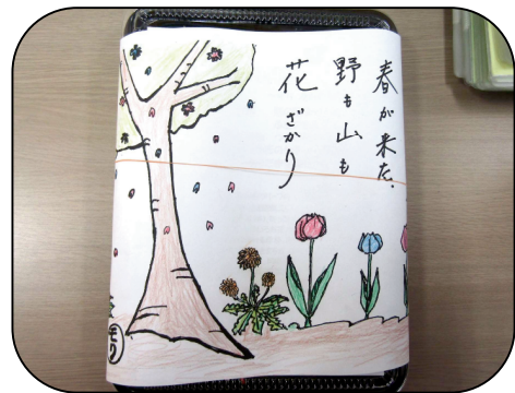
5月のお楽しみ弁当の絵手紙