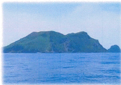
～ 松前町 小島 ～

松前町社会福祉協議会 字福山236-4 地域福祉交流センター ゆいっこ通信 8月号 令和3年8月1日 発行 電話 42-2270