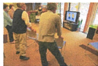
住民主体サロン・福山教室 ～いきいき百歳体操の様子～