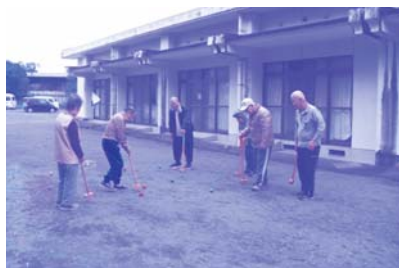
グラウンドゴルフ練習