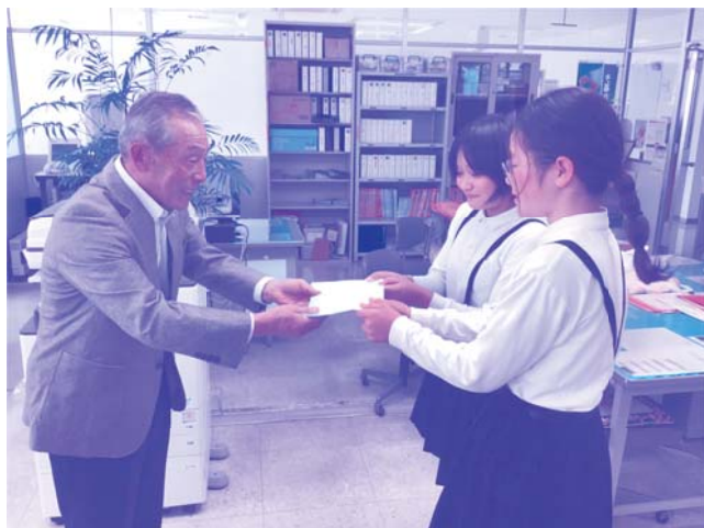
内之浦小学校児童生徒より募金をあずかりました。