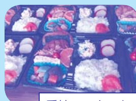
愛情のこもったお弁当