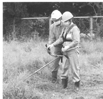
講師（県林業・木材製造業労働災害防止協会）の指導を受ける参加者