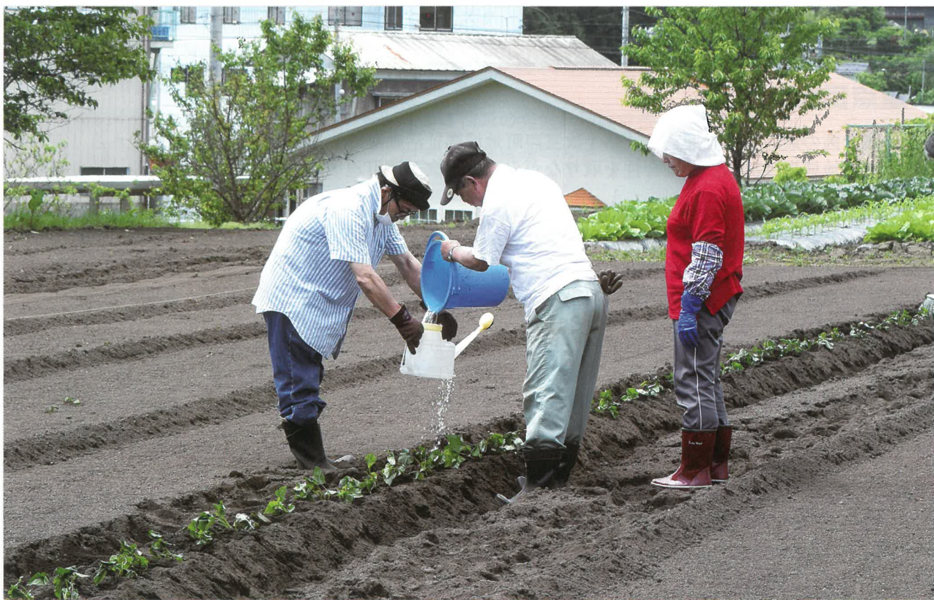
地域活動支援センター「憩いの森あすもこっ」サツマイモを植える様子(R2.6.3)

住み慣れた地域で、だれもが安心して暮らせるような福祉社会をめざしてがんばります!!