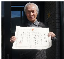
< 白樺会 >