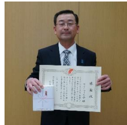
< アイ・ウィル会 >