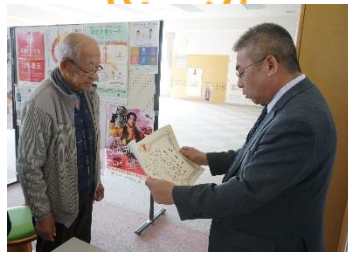
< 曙会 >

赤い羽根共同募金運動の推進に尽力した功績が認められ北海道共同募金会から「老人クラブ曙会」、「老人クラブ白樺会」、「アイ・ウィル会」の3団体が表彰を受けました。永年において街頭募金奉仕者として協力をいただき、その功績が認められたものです。