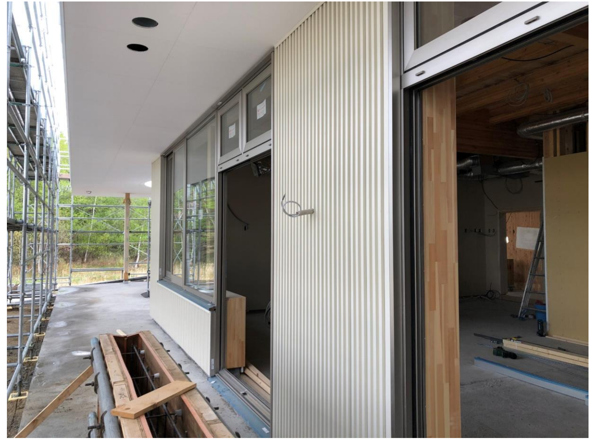
◇外壁は耐久性の高いガルバリウム鋼板です。