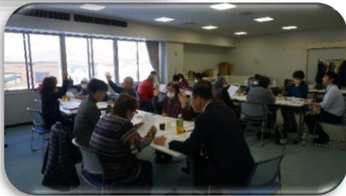
防災ゲームクロスロード