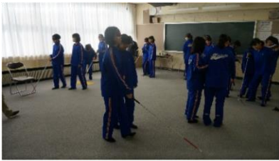
視覚障がい歩行体験