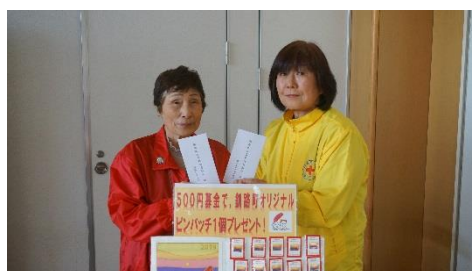
< 釧路町赤十字奉仕団 >