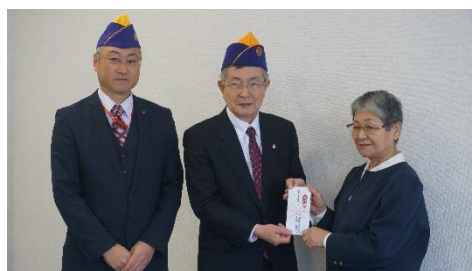
< 釧路湿原ライオンズクラブ >

当会では、多くの個人・団体の皆さまからご寄付いただき福祉活動の推進へ活用させていただいております。今年度もさまざまな団体からご寄付をいただきました。