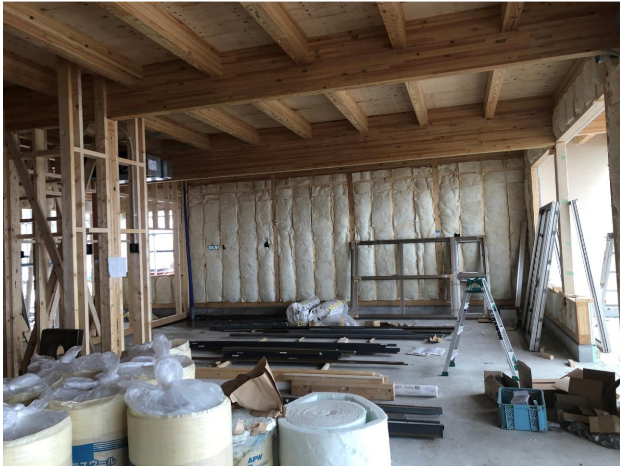
◇壁に断熱材が施工されています（白色のもの）