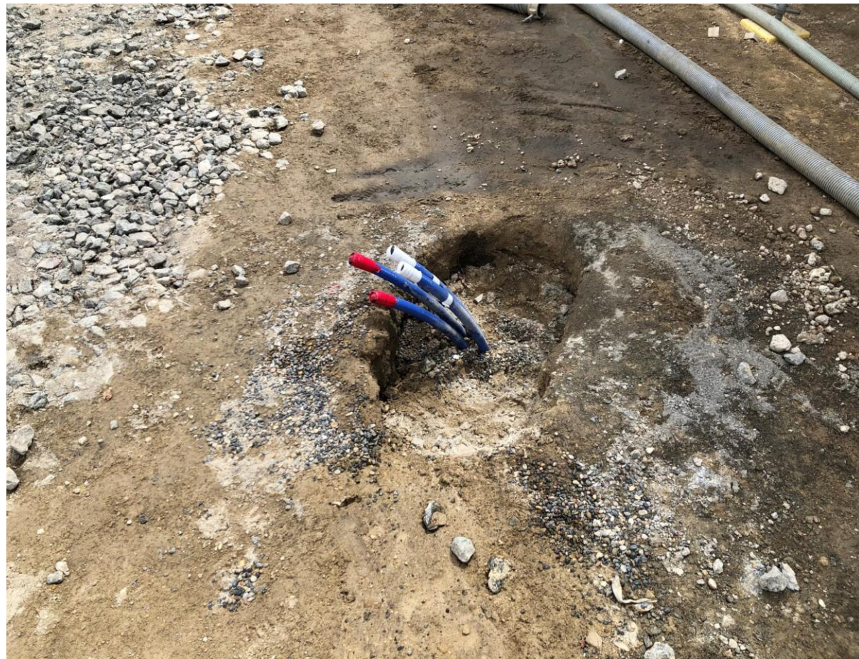
◇地中熱工事。このチューブは100m先まで埋まっています。