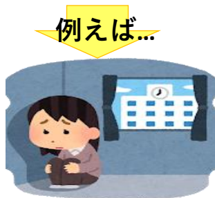
家族がひきこもり