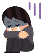
誰でも良いから話を聞いてほしい