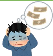
生活するお金がない