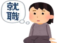
就職の相談をしたい