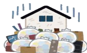
近所のごみの問題