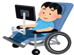
障がいのある方が利用できる制度は？