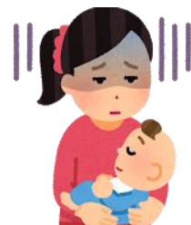
子育てが不安・辛い