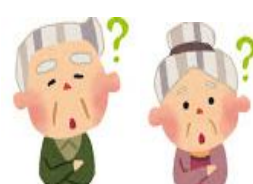
地域のために何かしたい