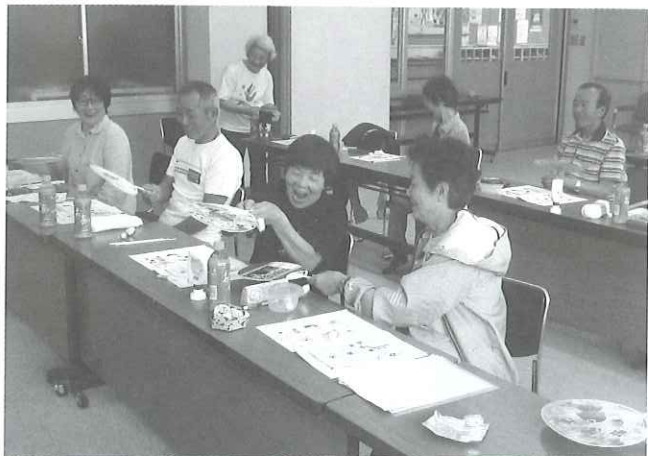
うちわで玉送りゲーム

各地区サロンへ出向いて体操やレクリエーション等を指導していただくことを目的に、8月末から約1か月、全4回にわたるサロンプログラムボランティア養成講座を開催しました。専門の講師を招き健康体操や簡単にできる工作を学び、参加者からは「すぐ実践できる体操や工作が学べてためになりました。」という感想もいただきました。講座修了者の中から13名の方にボランティア登録していただき、今後は各地区サロンで活躍していただきたいと思います。