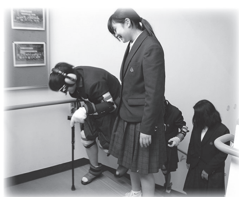
高齢者疑似体験の様子

1年生は認知症の原因や症状を学び、高齢者疑似体験を通してお年寄りの気持ちやサポートの方法を考えました。〈生徒の感想より〉私の家にはおばあさんがいます。体験してみても、階段や坂を「苦しい」と言っているのぼついているおばあさんの気持ちがよく分かりました。おばあさんを私たち家族が温かく見守ることが大事だと思います。