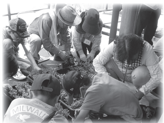
ポットへの移植の様子

中山路小学校では5・6年生が、「花の種まき、移植、宅配ボランティア」に取り組んでいます。4月に花の種をまき、保護者や地域の方々に手伝っていただきながらポットに移植して育てました。7月には校区内の全戸を一軒一軒回って、花の宅配を行いました。直接家に足を運ぶことで、地域の高齢者とのふれあいを深めました。