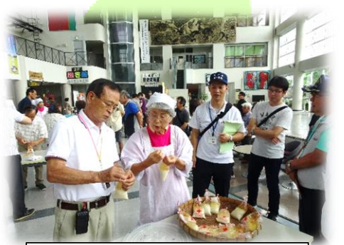
色々な人に取り組んでいただき 良い機会でした☆