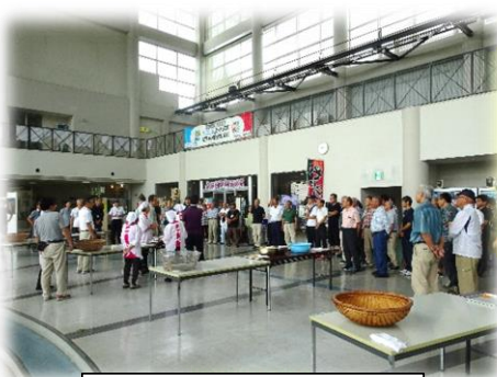
皆さんに炊出しの実習に参加してもらいました！

「災害現場や避難場所でのハイゼックス(熱に強いポリ袋)を使った非常食炊き出しの実習や取組みは、誰でもができるボランティア活動の一環であり、訓練を通して災害に対する安心・安全のために日頃の備えや地域のネットワーク連携の大切さを感じました。今回、初めて校区単位の訓練へ参加をしましたが、今後も、日赤奉仕団や社協をはじめ、市内の地域住民の皆さまや関係機関同士のつながりができるよう、活動を継続していきたいと思います。