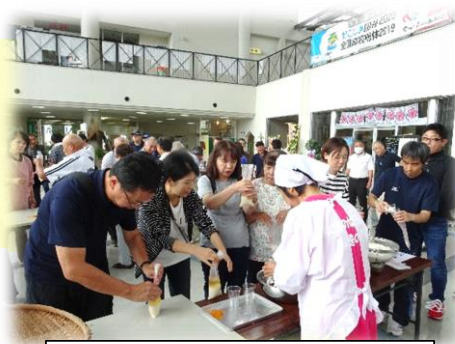
中々初めてだと難しいなあ～とのご意見！