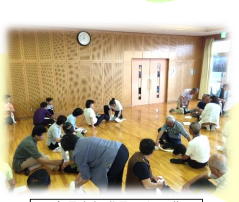
日赤県支部職員による講習