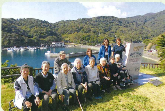
笠沙支所 ～秋目へバスハイク～