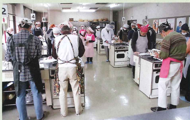
食生活改善推進員の説明を聞く皆さん