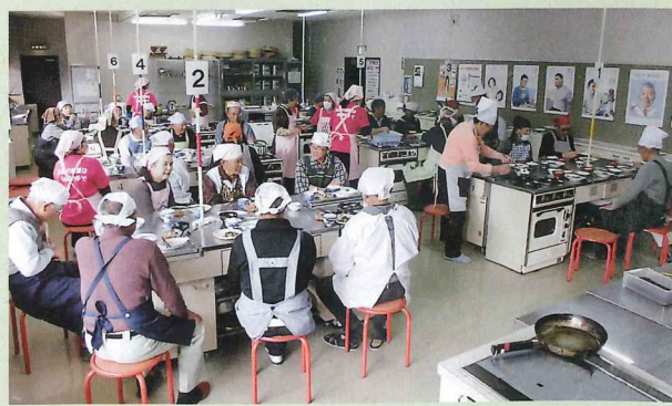
料理が完成したら、早速試食です。出来上がった料理を美味しそうに味わっていました。

11月19日(火)、南さつま市民センターにおいて、南さつま市老人クラブ連合会主催による、男性料理教室が開催されました。食生活改善推進員8名の協力のもと、男女合わせて30名の参加者が6グループに分かれ、調理を行いました。手際よく調理をされる方や初心者の方など様々な方がいらっしゃいましたが、和気あいあいとした雰囲気の中、グループ内で協力して、美味しい料理が出来上がっていました。