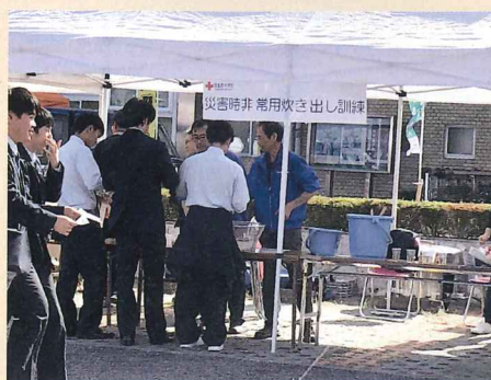
非常炊き出し訓練