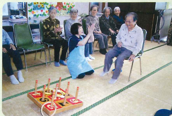
坊津支所 ～レクリエーションの様子～

笠沙支所及び坊津支所では通所介護事業所・生きがいデイサービス事業を行っています。みんなで一緒に笑ったり、体を動かしたりして楽しく一日を過ごしませんか？体験利用もできますのでお気軽にお問い合わせください。