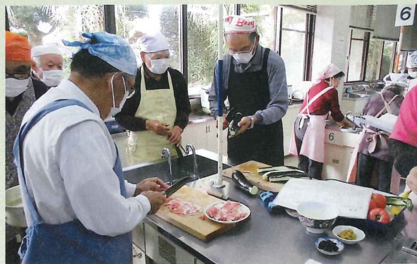
慎重に包丁を握りながら調理を行いました。