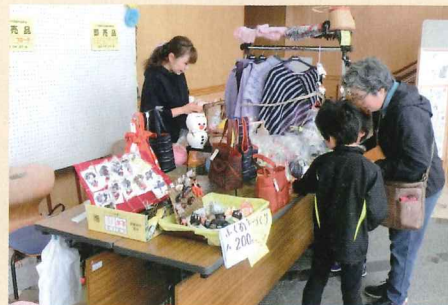
高齢者作品即売会