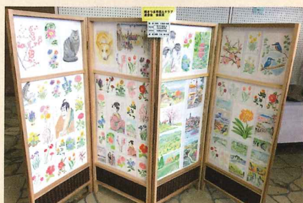
南さつま市老人クラブ連合会長賞 大野えびす会（金峰） 作品名「手作り屏風」と「大人の塗り絵」