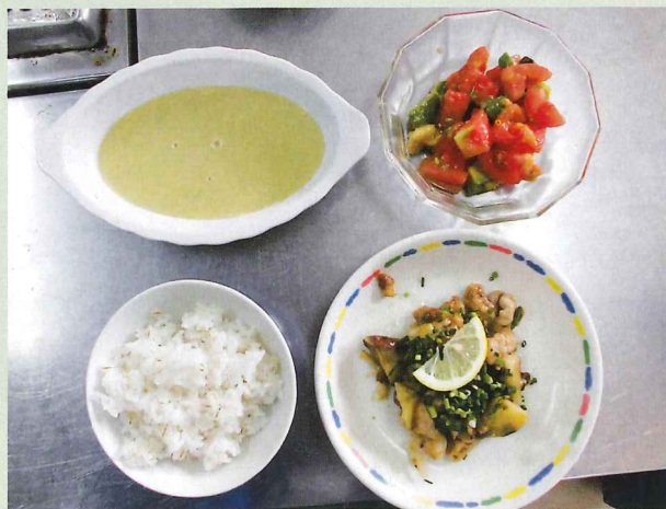
麦ごはん、冷製にがうりスープ、トマトとアボカドのサラダ、なすと豚肉のさっぱり炒めの計4品を作りました。