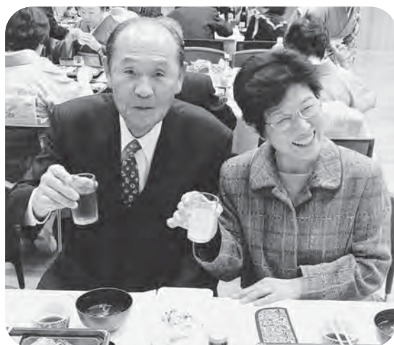
▲仲睦まじく、二人並んで「50年に乾杯!!」

金婚を迎えられた皆様、大変おめでとうございます。益々のご健勝をお祈りいたします。