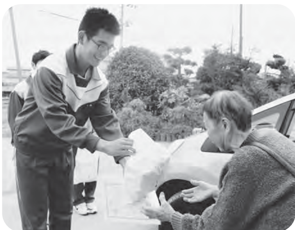
▲被災地域へ生活用品と『まごころ』をお届け！（大崎市鹿島台・写真は大崎タイムス社より提供）

昨年10月に宮城県を襲った台風19号は、各地に大きな被害をもたらしました。社会福祉協議会では大規模な災害が発生した際に『災害ボランティアセンター』を設置し、発災直後の被災した家屋の片づけといった直接的な支援から、被災された地区のケアやコミュニティの再生まで、多様で息の長い支援活動を行っています。