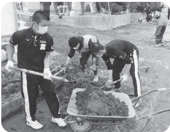
▲学生の皆さんも大活躍！（大崎市鹿島台）