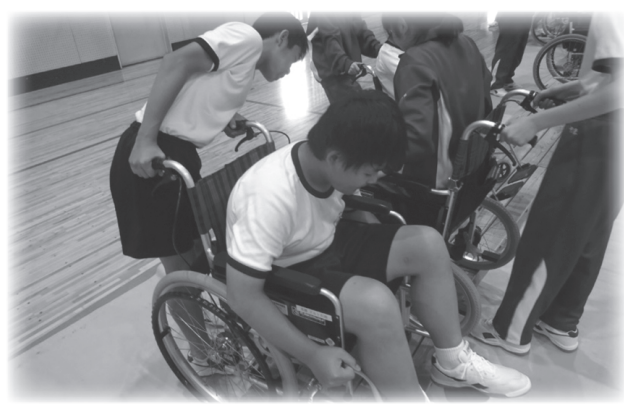
車いす体験の様子

ゲストティーチャーを講師に招き、肢体障がい者理解と車いす介助体験を行いました。車いすの介助体験をする中で、操作の難しさ等を学びました。また、実際に車いすに乗ることで、少しの段差や坂道での怖さ等も体感することができ、丁寧な対応をすることの大切さを学びました。