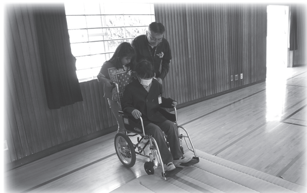
車いす体験の様子

社会福祉協議会の方々に来ていただき、車いす体験をしました。車いすに乗る役と、それをサポートする役の両方を体験しました。段差のある場所や足下が不安定な道での体験を通して、車いすを扱う際の注意点や車いす生活をしている方の気持ちを学ぶことができました。