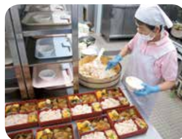
訪問給食サービス