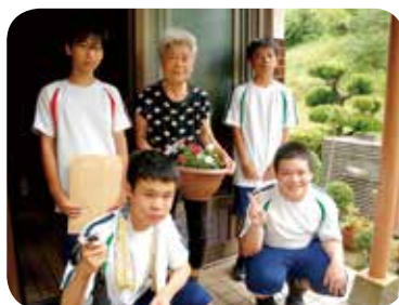
フラワーリンク活動