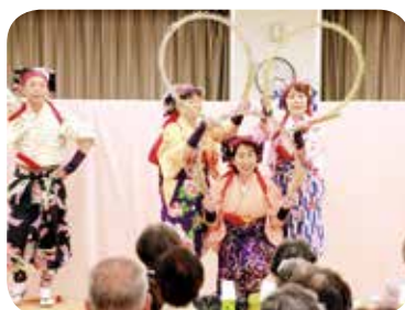
一人暮らし老人の集い