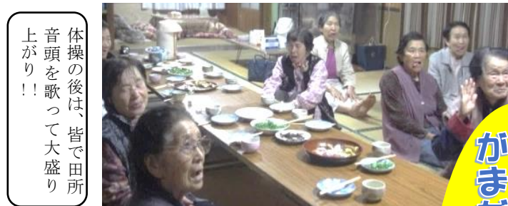
体操の後は、皆で田所 音頭を歌って大盛り 上がり!!