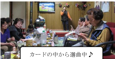
カードの中から選曲中♪