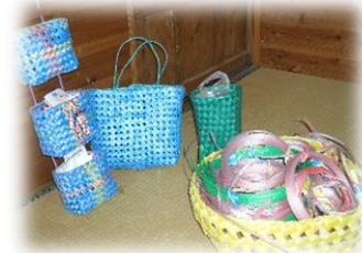
籠バッグの他にも 沢山の作品を作られています