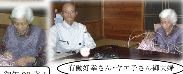
御年 90 歳!