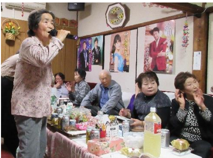
身近な集いの場 となっています