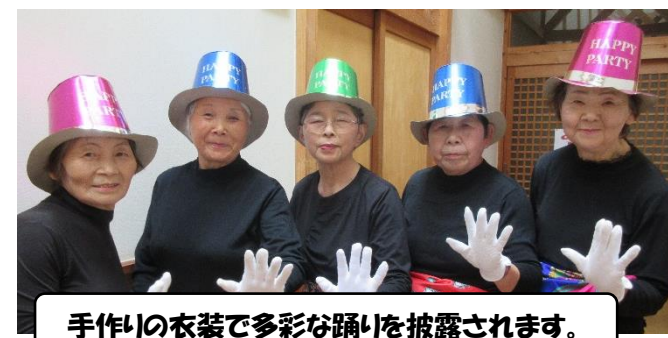
手作りの衣装で多彩な踊りを披露されます。