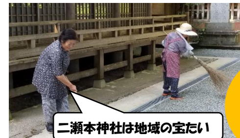
二瀬本神社は地域の宝たい