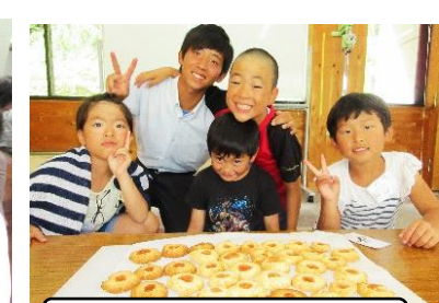
矢部高校生とクッキーづくり