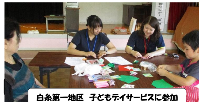
白糸第一地区 子どもデイサービスに参加

8月8日から9月14日までの23日間、熊本学園大学より社会福祉士の実習受け入れを行いました。山都町社協の事業及び社会福祉士の業務を一通り経験していただき、その学びを活かして個別支援計画を立てるとい実習内容でした。地域の自主的なサロン等にも参加させていただき、山都町の地域福祉に大いに触れる機会となりました。