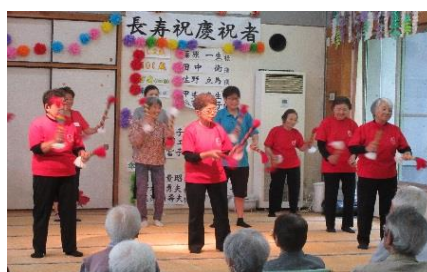
毎月 1 回福祉施設も訪問されています！！