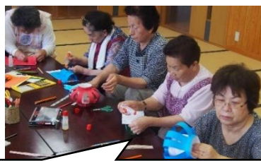
真剣な目つきで取り組まれています

二瀬本地区では毎月 10 日、二瀬本神社の清掃作業が行われています。二瀬本神社は千年以上前に建てられた神社との事で、地域の貴重な文化財を守るため、毎月欠かさず行われているそうです。作業終了後は交流館に集い手工芸に取り組み、様々な作品に挑戦されています。完成した作品を眺めながら持ち寄ったお茶菓子をお供に、お喋りにも花が咲きます。地域の文化財を守る事で人が集まり、サロン活動にも繋がっており、それらが安否確認や情報交換、認知症予防の場にもなっています。