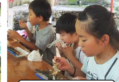
舟の口養魚場にて魚釣り