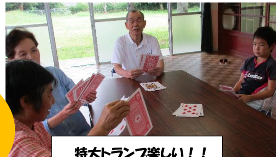
特大トランプ楽しい！！

8 月、白糸第一地区では、旧白糸保育園の建物を活用した通潤交流館にて地域独自の子どもデイサービスが行われました。夏休みを利用して地域の子どもから高齢者など幅広い世代の人達が集える場所として賑わいました。学習の時間や遊びの時間などは子ども達が自主的に考えて取り組み、短期間でありますが子ども達の成長がうかがえる機会となりました。子ども達にとっても地域のおじさんおばさんと親しくなった事で地域を思う気持ちがこれまで以上に大きくなったのではないのでしょうか。