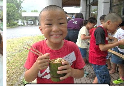
そうめん流し うまい!!

夏休み子どもデイサービス 猛暑に負けない、元気いっぱいの子も達!! 今年も清和支部で3日間、蘇陽支部で2日間の子どもデイサービスを実施しました。矢部高校生、民生委員児童委員、地域のボランティアの方々にお手伝い頂きながら楽しい夏の思い出ができました。