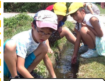
水が冷たくて気持ちいい～