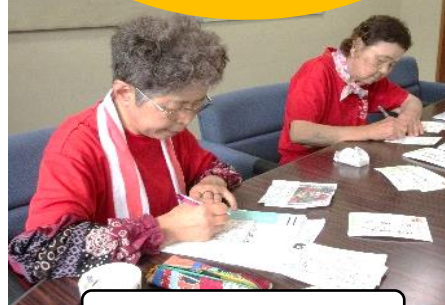
一人一人に心を込めて