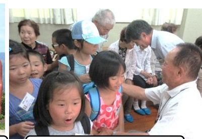
緑川清流館で七夕交流