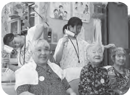
▲デイサービス事業