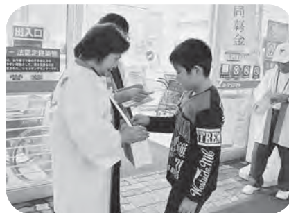
▲赤い羽根共同募金運動