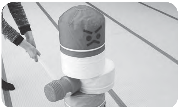
▲シャッフルボード（写真上）とダルマ落とし（写真下）

社協では、ミニデイサービスの案内状の印刷・作成やレクリエーション用品の貸し出し、献立の作成等を行い、行政区のミニデイサービスを応援しています。このたび新たな貸し出し用品として『シャッフルボード』と、小野田ボランティア友の会様からの寄付により購入した、大きなサイズの『ダルマ落とし』という2品が仲間入りしました！ミニデイや地域行事などにぜひご使用ください。