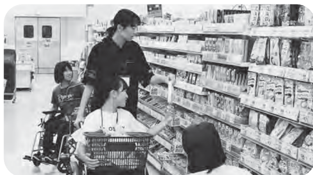
▲車イスに乗りながら町内で買物体験（昨年度より）

参加申込につきましては、6月中旬頃に各中学校を通じて募集を行います。本事業に関するお問い合わせは加美町社協本部（63-2547）までご連絡下さい。今年も元気な中学生の皆さんの参加をお待ちしています!!