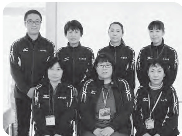
▲介護でお困りの際は、いつでもご相談ください！

現在、加美町社協では中新田地区に事務所を置き、ケアマネジャー7名体制で地域に根差したサービスを心がけ、支援を行っております。要介護認定を受けたが、どのようなサービスを利用していいかわからない時や、家族の体調が優れず介護が必要な時など、どうぞお気軽にご相談ください。