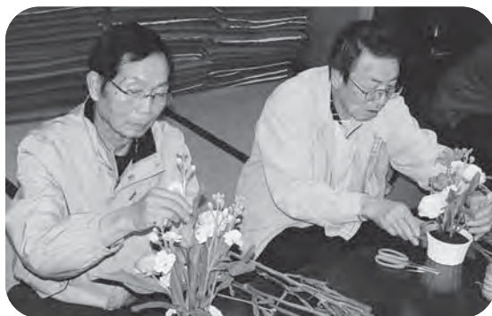
▲男性陣も真剣な表情！「ここでもいいかな…？」

参加者からは「色とりどりの花を見ることができ、春を感じられて楽しかった」「カラオケもできていい気分転換になりました。また次回も参加します」などの声が寄せられました。