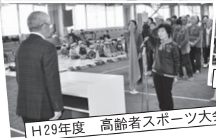
H29年度 高齢者スポーツ大会