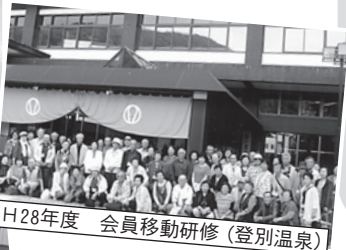
H28年度 会員移動研修（登別温泉）