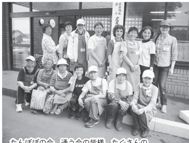
たんぽぽの会、通う会の皆様、たくさんのご参加ありがとうございました！