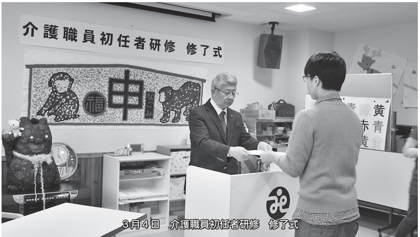
3月4日 介護職員初任者研修 修了式