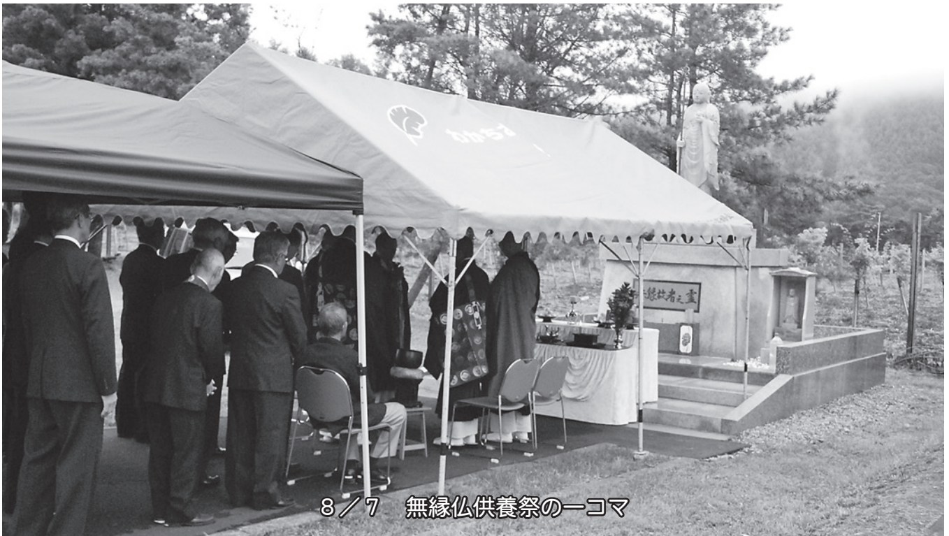
8/7 無縁仏供養祭の一幕