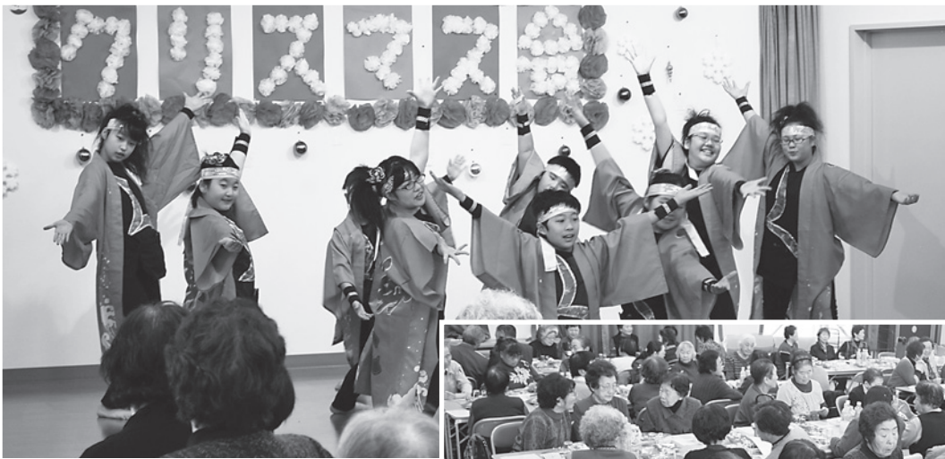
平成26年12月7日（日） 独居高齢者クリスマス会の様子