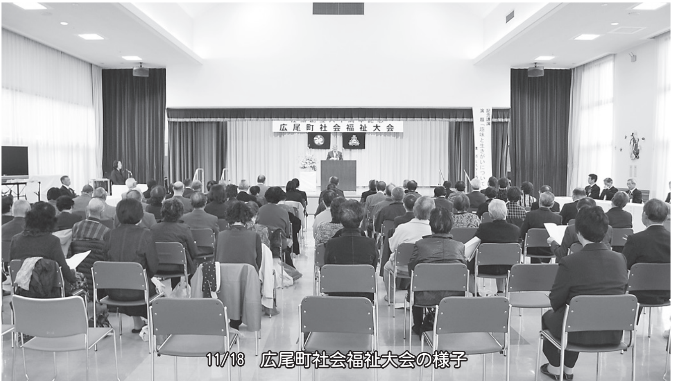
11/18 広尾町社会福祉大会の様子