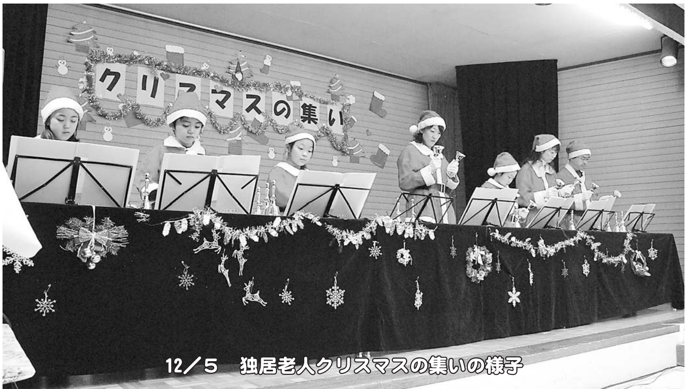
12/5 独居老人クリスマスの集いの様子