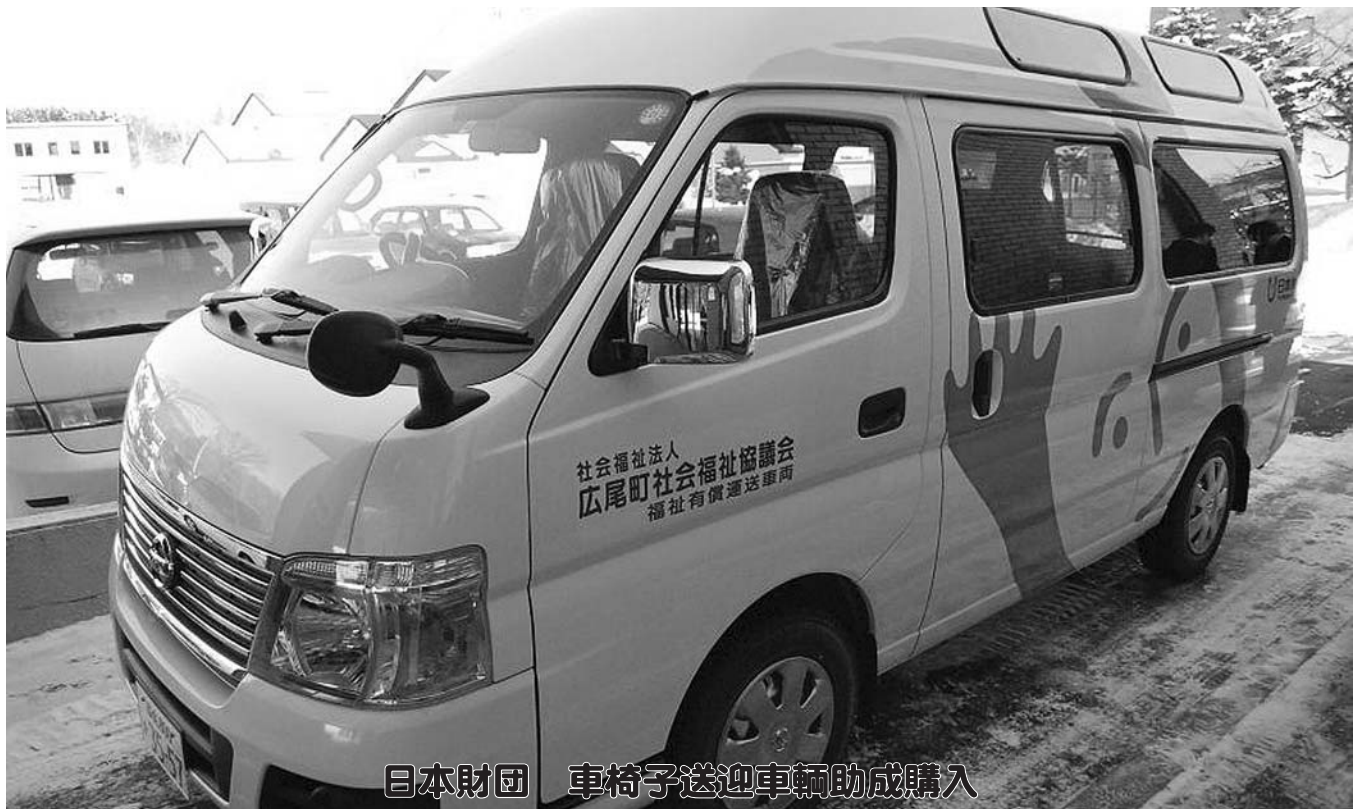
日本財団 車椅子送迎車輛助成購入