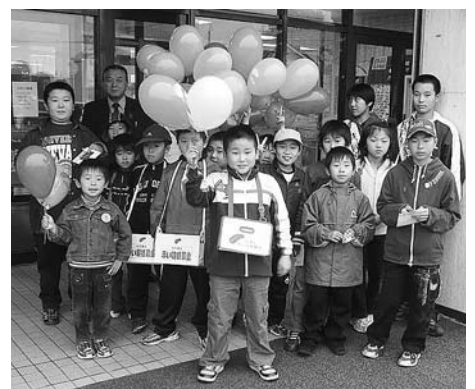
柔道少年団による街頭募金の一コマ