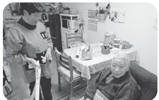
▲「いつもありがとね♪」この笑顔が原動力です！