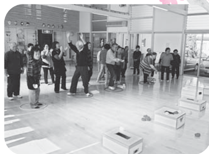
▲ミニデイサービスサポート事業