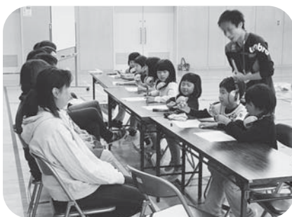
▲親子で福祉体験学習（広原小）