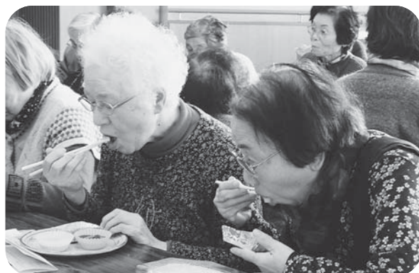
▲今年もおいしいお餅に舌鼓♪