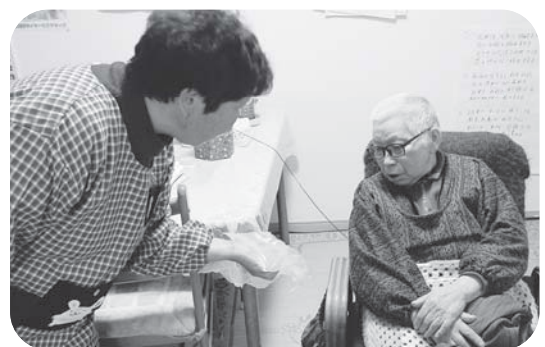
▲今日は掃除。「これは？」「なげでけらいん♪」

訪問介護は、利用者本人の在宅生活をサポートするだけでなく、ご家族皆様の介護負担の軽減を図ることにもなります。どうぞお気軽にご相談ください。