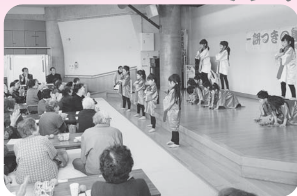
▲子どもたちの元気なお遊戯に大きな拍手!!

その後にはお待ちかねのお餅が登場。今年も宮崎もち加工組合による、あんこ・ずんだ・くるみの3種類のお餅と、お雑煮をいただきました。参加された皆さんは「また来年も、ここで元気にお会いすっぺね！」「あんだもいい年とらいんよ～！」などと声を掛けあい、新年での再会を約束していました。