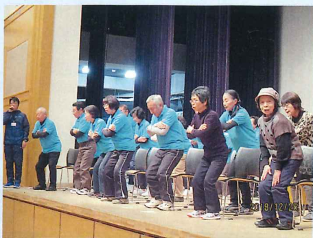
実際にころばん体操にチャレンジ!!