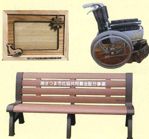
平成30年度 共同募金実績 (単位：円)

なお、共同募金配分事業においては、新生児誕生贈呈事業のフォトフレームや地域用のベンチ、貸し出し用の車いす等を購入し、市民の皆さまのために活用させていただきます。