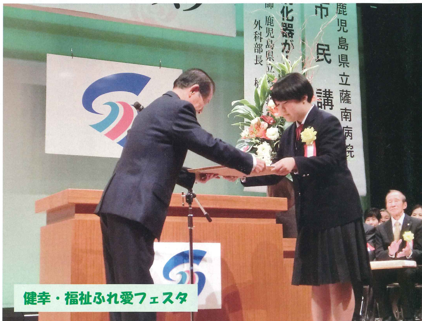
健幸・福祉ふれ愛フェスタ

11月18日(日)、ふれあいかせだにおいて健幸・福祉ふれ愛フェスタが開催され、屋外では、非常炊き出しやぜんざいのふるまい、ふれあいかせだの研修室では、高齢者作品展示を行いました。また、いにしへホールにおいては、認知症フォーラムを開催し、多くの市民の皆さまにご来場いただきました。