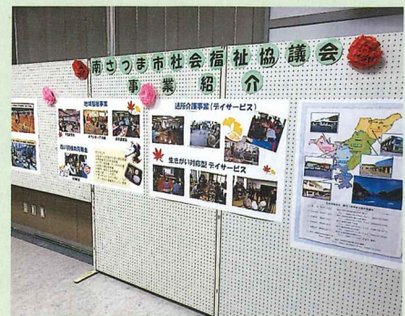
南さつま市社協事業紹介