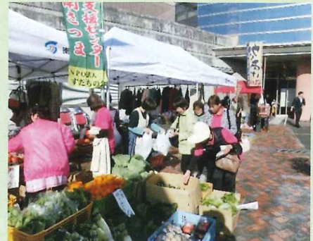
ふれあいマーケット