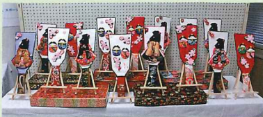
南さつま市長賞 てまり会(加世田) 作品名「羽子板」