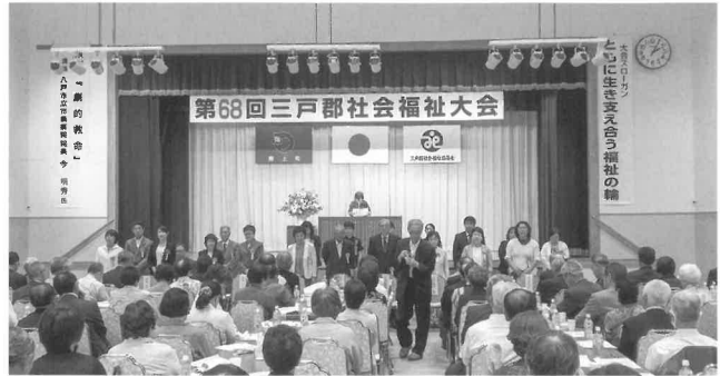
大会式典 受賞者代表謝辞の様子