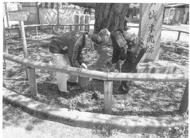
標準木へ肥料を蒔く様子。来年もきれいな桜が咲くように願いをこめて