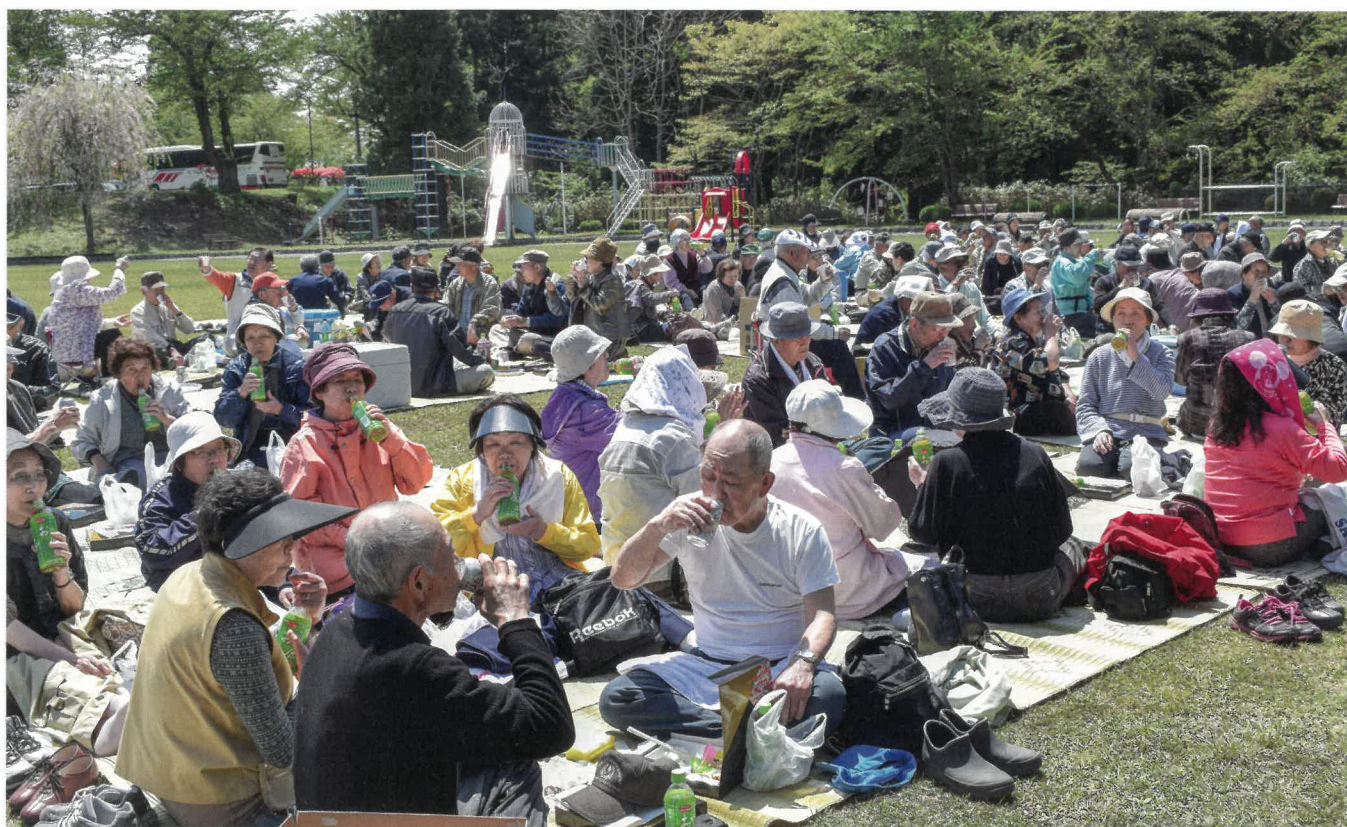
三戸町シニアクラブ連合会 観桜会の様子 (H30.5.7 城山公園にて)

住み慣れた地域で、だれもが安心して暮らせるような福祉社会をめざしてがんばります!!