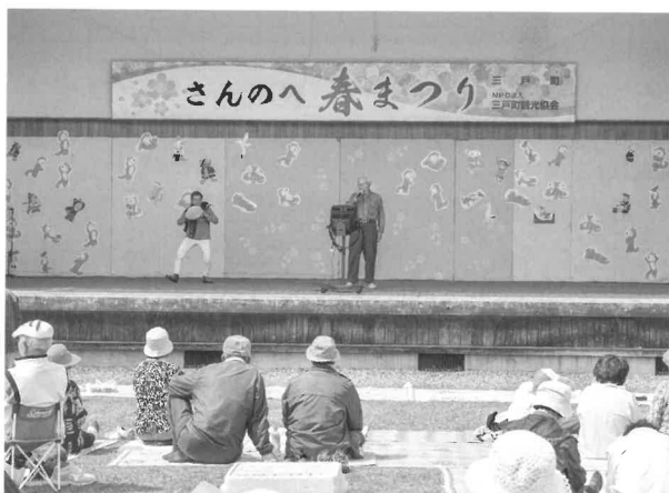
観桜会は得意の歌や踊りを披露するまたとない機会。たいへん盛り上がりました