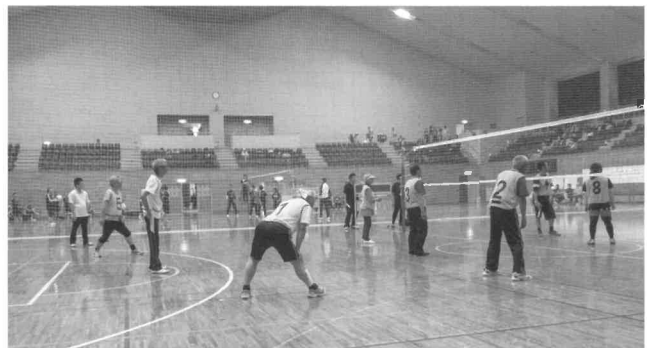
ソフトバレーを楽しむ様子

また、当日はスポーツ交流タイムと称して、ボッチャや卓球バレー、フライングディスクといったニュースポーツにもチャレンジし、新しい体験を楽しんだ様子でした。