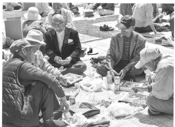
久しぶりに会う顔ぶれも多く、会話が弾みました