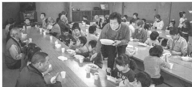
お昼ご飯はみんなでカレーライス