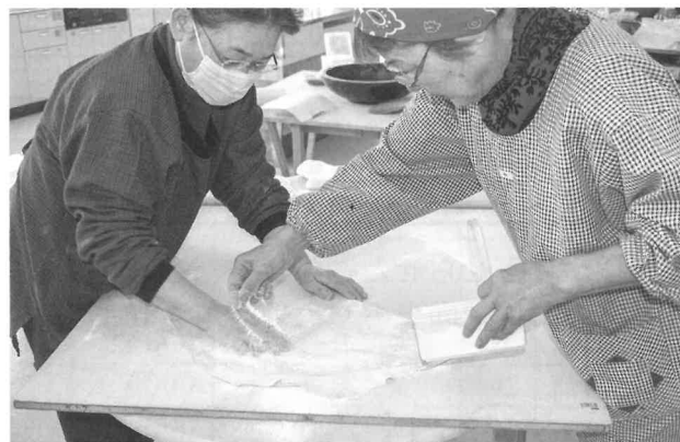
連携プレー。打ち粉を振りながらそばの生地を畳んでいます