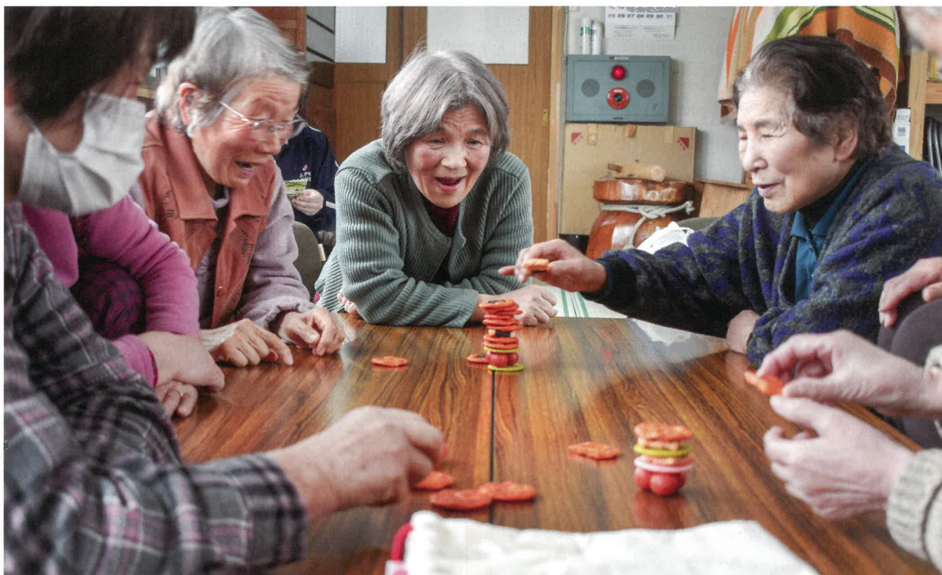
松原たのしみっこ レクリエーションを楽しむ様子 (H30.3.1 松原集会所にて)

住み慣れた地域で、だれもが安心して暮らせるような福祉社会をめざしてがんばります!!