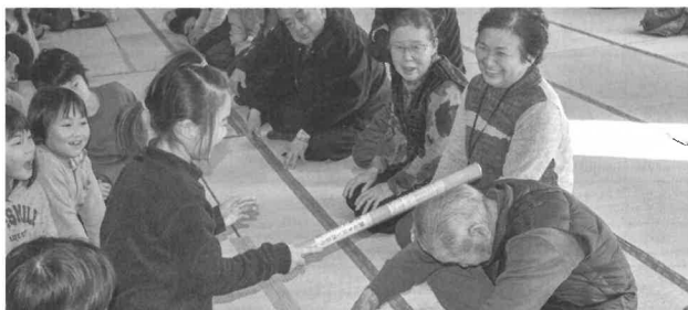
お見事面あり!でも、勝っても負けても楽しそうです