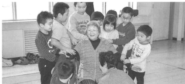
肩もみ競争。みんな笑顔です