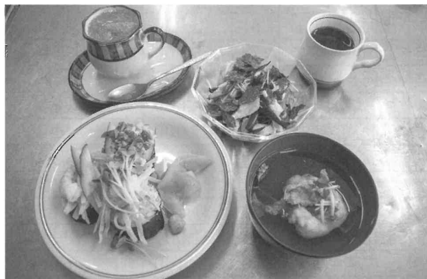
出来上がった料理。彩り豊かで春のきざしを感じるメニューとなりました