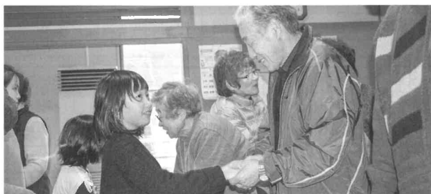
最後は全員と握手してお別れ。ありがとう、楽しかったよ、また会おうね。そんな声が写真からも伝わってきます