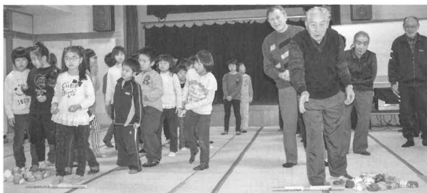
的を狙ってお手玉を投げています

昼食には老人クラブ女性部の皆さんが調理したカレーライスを全員で食べ、朗らかな雰囲気です交歓会を終えました。