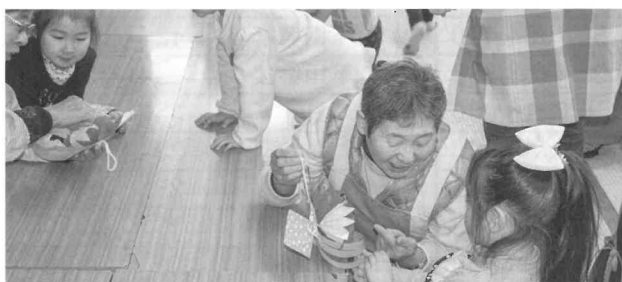
こどもたちから手作りのお正月かざり(写真左)や歌のプレゼント(写真右)が。この他にも、お遊戯や楽器演奏なども披露してくれました