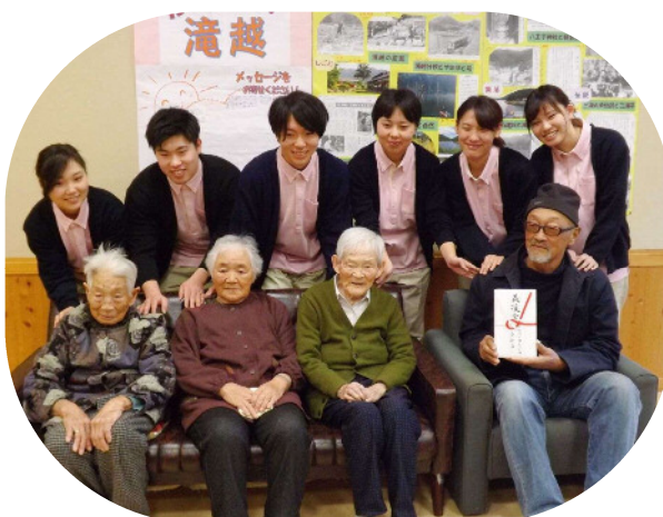
看護学校のみなさんから義援金 12月10日 木曽町の信州木曽看護専門学校の学生の皆さんが来所し、10月の学園祭で行ったチャリティーバザーの売上げを、村内で避難生活を送られる滝越区の皆さまに義援金として贈呈。地域の将来を担う若者からも、あたたかい支援が寄せられています。

私も滝越ののどかな風景を見に行きたいです。道路の早期開通を祈念しております。オール王滝でいっしょにがんばりましょう！