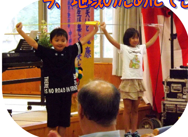
元気いっぱい！小学校3～4年生による縄跳びパフォーマンス。

高齢化や人口減少、また災害への対応・・・、地域の抱える課題の中で、今年度の福祉・健康の集いは、私たちの暮らす地域について改めて見つめ直し、地域のつながりや支え合いのあり方について、ともに考える機会となりました。