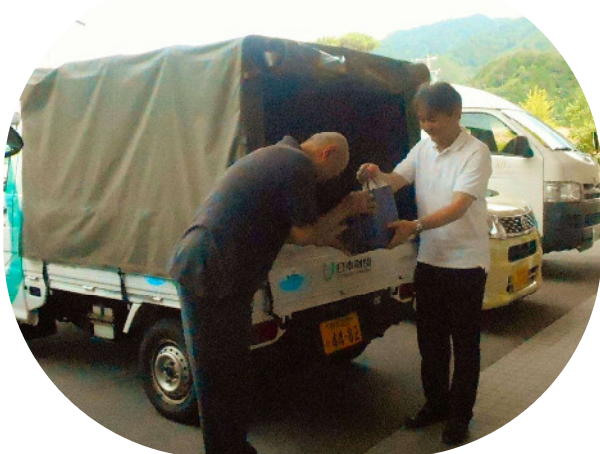
大桑村より食料品の御見舞い 7月11日 大桑村の社協より、村内で募ったフードバンク事業の食料品の一部が、保健福祉センターで避難所生活を送られる滝越の皆さまへ届けられました。

滝越は王滝にとって、とても特別な場所のように思います。一日でも早く道が直り、みなさんが元の生活に戻れますように！