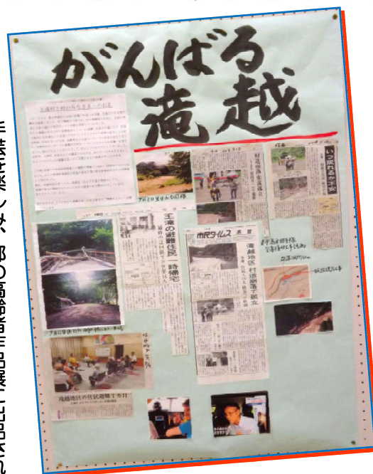
お礼の気持ちを伝えたいと、福祉・健康の集いに出展された滝越の皆さんの展示

今年の年末年始は不自由な避難先で過ごされる滝越の皆さまですが、村内、村外のみなさんから寄せられたあたたかいメッセージが少しでも皆さまの励ましとなり、また一日も早く住みなれたわが家での生活に戻れますことを心よりお祈りしております。