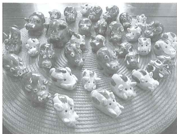
今年の干支を楽しみながら陶芸で作りました