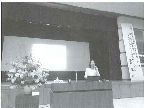
早田様による講演

が行なわれました。また、総合司会も務めていただき、来場者からも大変好評をいただきました。