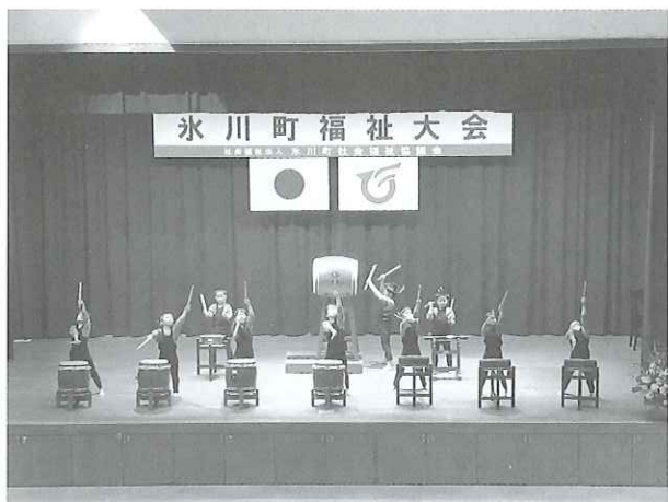
オープニングアトラクションの和太鼓 (常葉保育所)

体験発表では、ボランティア協力校でもある宮原小学校を代表して4年生の児童による活動発表