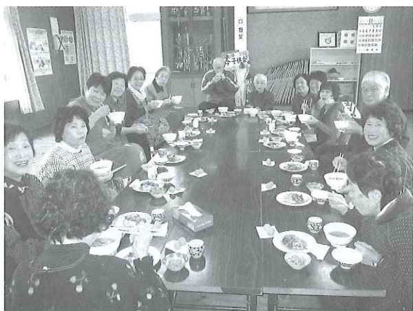
参加者全員で昼食会

4月は花見弁当を作り、裏の桜の下で花見をしたり、季節に合わせていきなり団子、みょうが饅頭、大福もちをみんなで手作りしておやつにしています。体操をしたりゲームをしたり、いつまでも元気で暮らせるように、サロンで生き生き頑張っています。