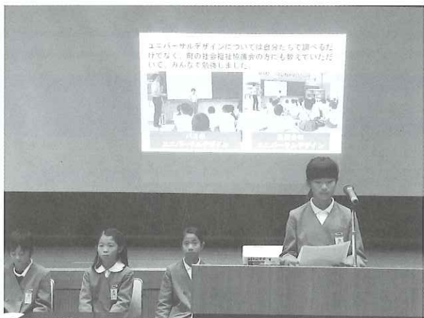
ボランティア活動発表 (宮原小学校)