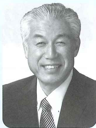
氷川町社会福祉協議会