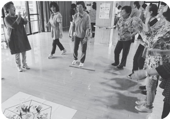
▲見事な投球に皆さん拍手喝采!!