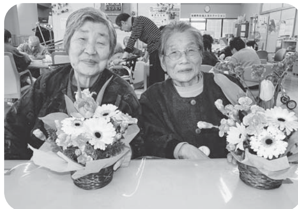
▲出来栄えに思わずニコリ! (フラワーアレンジメント)