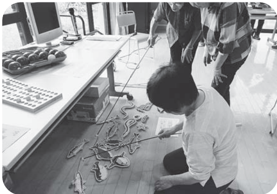
▲なかなか釣れないわ…。ああ悔しい!!

加美町社協では、ミニデイサービスサポート事業として、レクリエーション物品の貸し出しを無料で行っております。その貸し出し物品を体験いただき、使用方法や遊び方を学ぶレクリエーション研修会を、今年は加美町地域包括支援センターさんと一緒に、下記の日程で開催します。