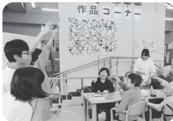
▲孫たちとジャンケン・ボン!! (中学生との交流会)

また、夏祭りなどの季節行事のほか、講師を招いてフラワーアレンジメントなども行っています。男性の参加者も多く、自分が作った作品を持ち帰ることができるなんて、利用者さんには人気のイベントです。施設見学も随時受け付けておりますので、下記までお気軽にお問い合わせください。