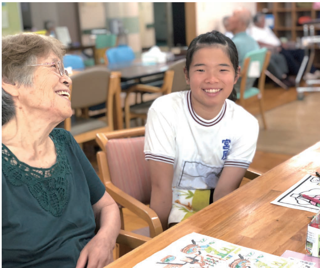
特別養護老人ホーム早尾園での活動の様子