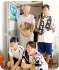
フラワーリンク活動