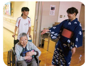
夏のボランティア体験