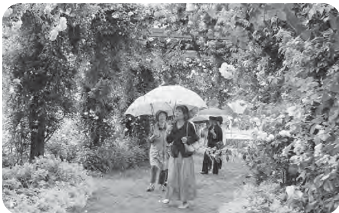
▲雨に濡れるバラのトンネルをくぐり抜けて