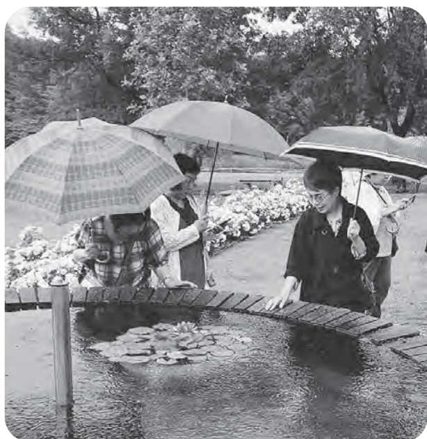
▲この時期には珍しく睡蓮の花も一輪咲いていました。