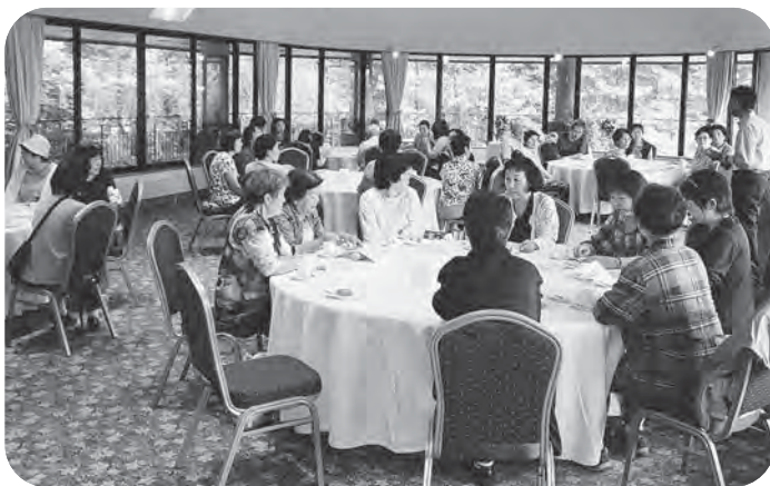
▲美しい庭園を眺めながらのティータイム♪

閉会を迎えるころには、常連の参加者の皆さんは「次は日帰りの旅行だね？また次も会うべね～♪」「去年は平泉だったから、今年は浜のほうへ行きたい！」など、早くも次回を楽しみにしている声が聞かれました。次回も多くの皆さんの参加をお待ちしています！