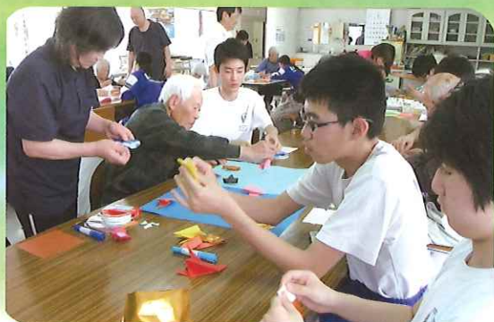
中学生との交流事業

デイサービスの利用等 につきましては、お気軽に 各デイサービスセンターに お問い合わせ下さい!!