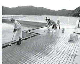
プール清掃の様子 (瀬戸地区)