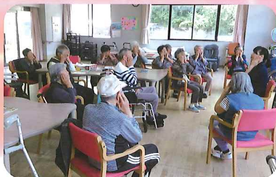
食事前の口腔体操