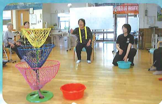
レクリエーション活動