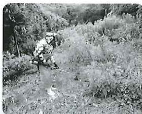
草刈り作業の様子 (伊方地区)