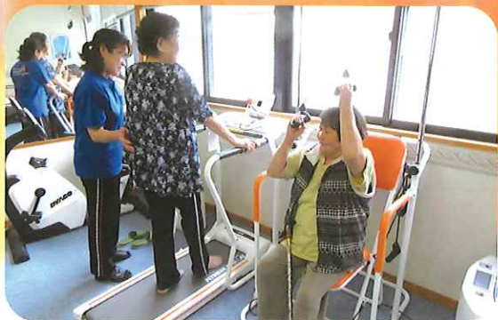
器具を使って リハビリ運動