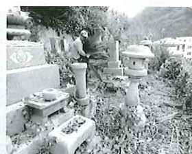
お墓掃除の様子 (瀬戸地区)