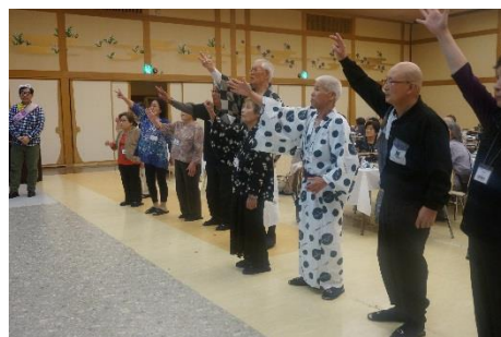
< 景品争奪ジャンケン大会 >

釧路町老人クラブ連合会事務局（担当 澤田） 電話 405220 毎年恒例となりました湯治運動も第55回目を迎えました。町内の皆様と一緒に温泉に浸かり、美味しいお食事を楽しまながら親睦を深めています。演芸大会や景品の当たるゲームも開催します。多くの皆様のご参加をお待ちしております。 4月13日（金）～15日（日） 阿寒湖温泉 ニュー阿寒ホテル 町内にお住いの満60歳以上の方 参加費 13,000円 申込締切 4月5日（木） 老人クラブ会員の加入クラブにお申込み下さい。 い。老人クラブの会員でない方は釧路町老人クラブ連合会またはお近くの老人クラブへ参加費を添えてお申込み下さい。