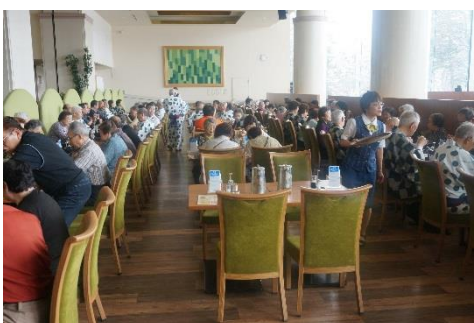
< 2日目昼食 >