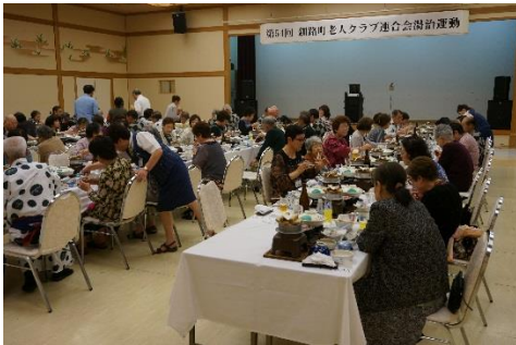
< 懇親会 >