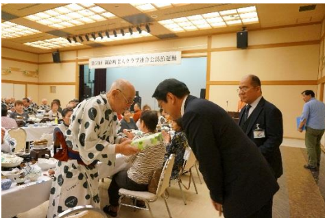
< 最高年齢者表彰 >