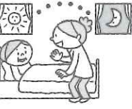
長時間の見守り・話し相手