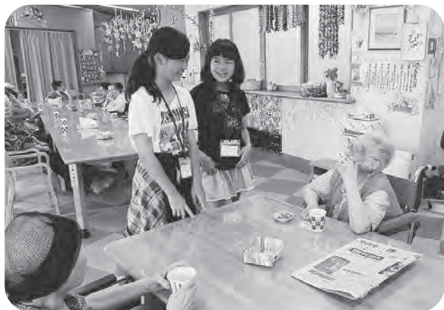
▲おばあちゃんのお話し相手に（施設ボランティア）