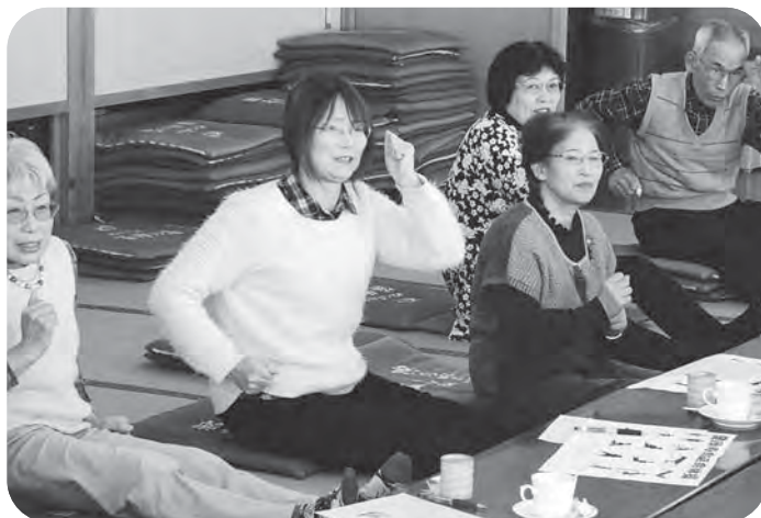
▲「お尻歩き」で筋トレ。大きく腕を振って「1、2!」