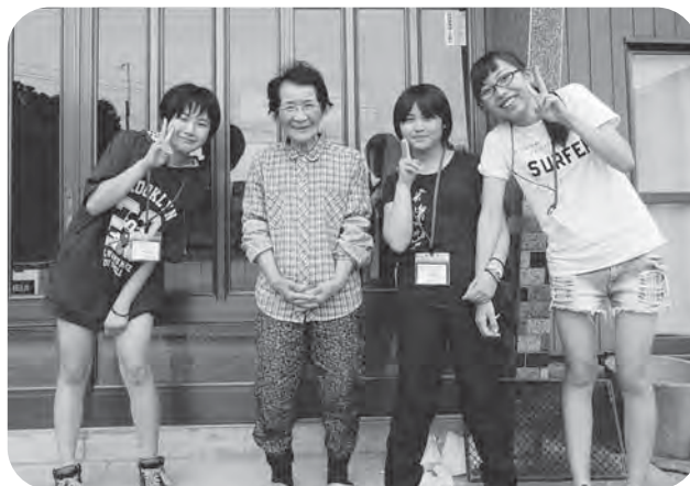
▲利用者さんと記念に1枚！（配食サービスボランティア）