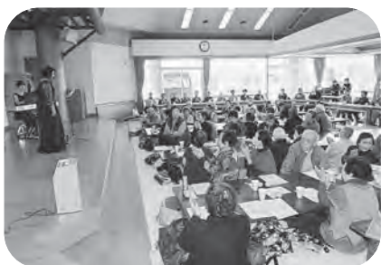
▲一人暮らし高齢者の集い