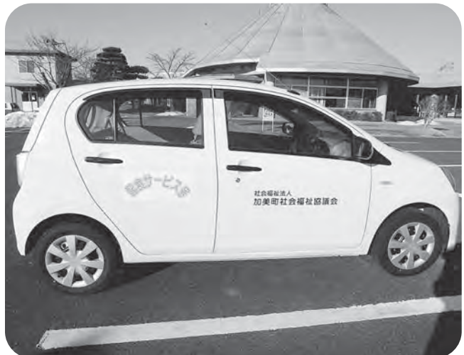
▲「配食サービス号」配達時にご利用ください!!