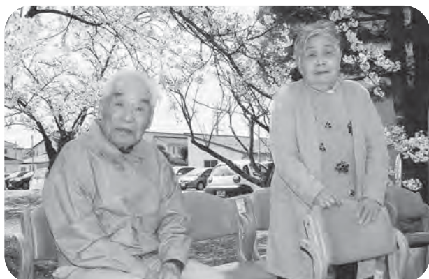
▲桜をバックに二人並んで「はい、ポーズ!!」

中新田デイサービスセンターが併設されている中新田福祉センターの敷地内には、桜の木が複数植えられており、毎年春には見事な花を咲かせて来所される方々の目を楽しませてくれています。今年も4月10日頃から咲きはじめ、数日後には満開となりました。