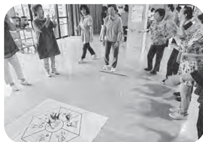
▲ミニデイサービスサポート事業