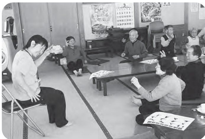
▲右手はパーで左手はチョキで…あれ?どっちだ??

参加者からは「介護が必要な家族のためにも、自分の健康にも気をつけたい」「日頃の自分の生活習慣を振り返るいい機会になった。もっと先生にいろいろな話を聞きたい」などの声をいただき、閉会後も先生を囲んで質問する姿も見られ、楽しい時間はあっという間に過ぎて行きました。