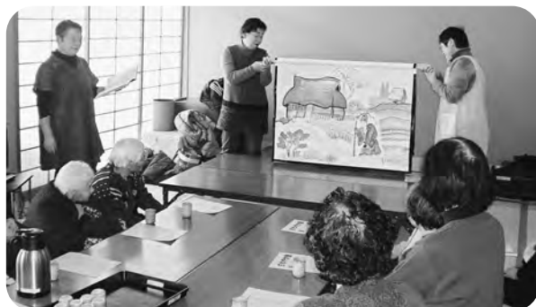
▲おひさまの会手作りの大型紙芝居

参加された皆さんは、ボランティアの皆さんによる多彩な内容に夢中！時間を忘れるぐらいに引き込まれ、終始笑顔があふれていました。