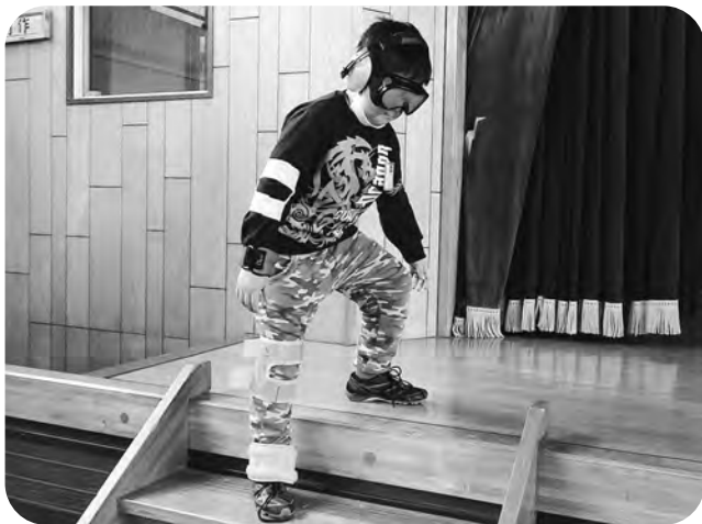
▲おとっとと…いつもはなんでもないので…（旭小）