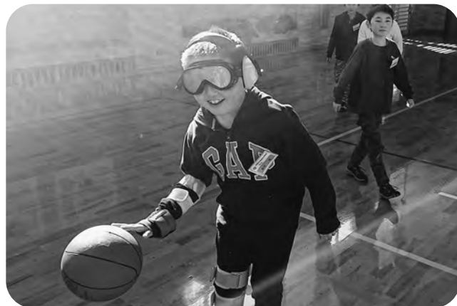
▲友達のをを頼りにドリブル（賀美石小）