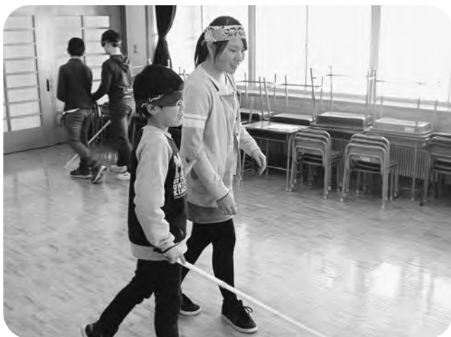
▲ガイドヘルパーさんがいれば移動も安心（東小野田小）

ほとんどの子供たちが初めての体験ということで、「怖かった」「大変だった」という声が多い中、「お年寄りや障害がある方には段差があることがどんなに大変なことか初めてわかった」、「大変な時は声をかけてお手伝いしたい」など、様々な「気づき」が生まれていたようでした。