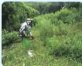
草刈り作業の様子 (伊方地区)