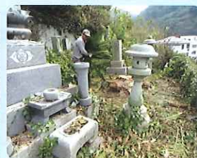
お墓掃除の様子 (三崎地区)