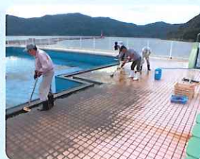
プール清掃の様子 (瀬戸地区)